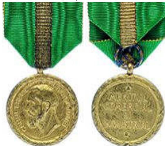
Medalia „Meritul Comercial și Industrial” clasa I (avers și revers).