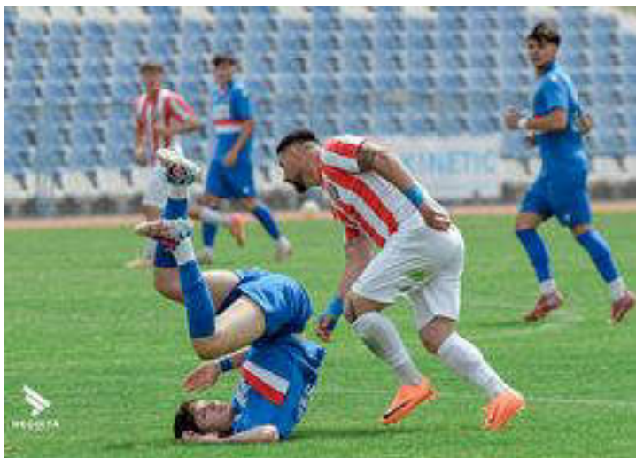
ocupanta locului secund CS Drobeta 2024. Echipa severineană a făcut

Sezonul 2025-2026 din Liga a 4-a Mehedintzi s-a încheiat la sfârșitul săptămânii precedente, o dată cu disputarea etapei a 26-a. În ultima rundă, s-au jucat însă doar 4 partide. Dacă Viitorul Strehăia nu s-a prezentat în deplasarea de la Breznița Ocol, Viitorul Cujmir și CS Drobeta Turnu Severin au câștigat tot la "masa verde", după ce adversarele Victoria Drobeta Turnu Severin și CS Corcova fuseseră excluse din campionat. S-a disputat în schimb partida de la Gârla Mare, unde Unirea din localitatea a fost învinsă cu scorul de 6-5 de