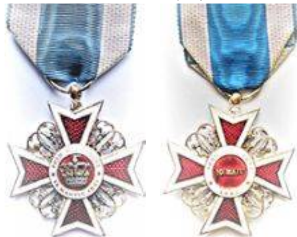
Ordinul „Coroana României” în gradul de Cavalier, model 1881 (avers și revers).