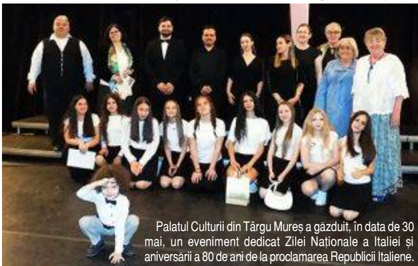
Palatul Culturii din Târgu Mureș a găzduit, în data de 30 mai, un eveniment dedicat Zilei Naționale a Italiei și aniversării a 80 de ani de la proclamarea Republicii Italiene.

Manifestarea a reunit membri ai comunităților istorice de italieni din România, reprezentanți ai minorităților naționale, oameni de cultură și numeroși admiratori ai valorilor și tradițiilor italiene.