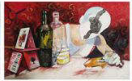
"Definiție artistică a identității" - 2025 Tehnica mixtă Lucrare expusă la Expoziția de Artă Vizuală dedicată celor 25 de ani de la Drobeta-Turnu Se- verin 23.04.2026

După cum se știe, pictorii sunt comunicatori ai limbajului emoțional exprimat deopotrivă formal și cromatic (deci non-verbal), iar creațiile lor sunt experimente al imaginației dublate de inteligență.