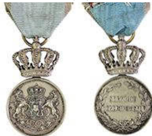
Medalia „Serviciul Credincios” clasa a II-a (avers și revers).