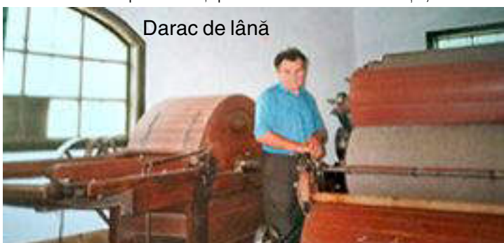
Darac de lână