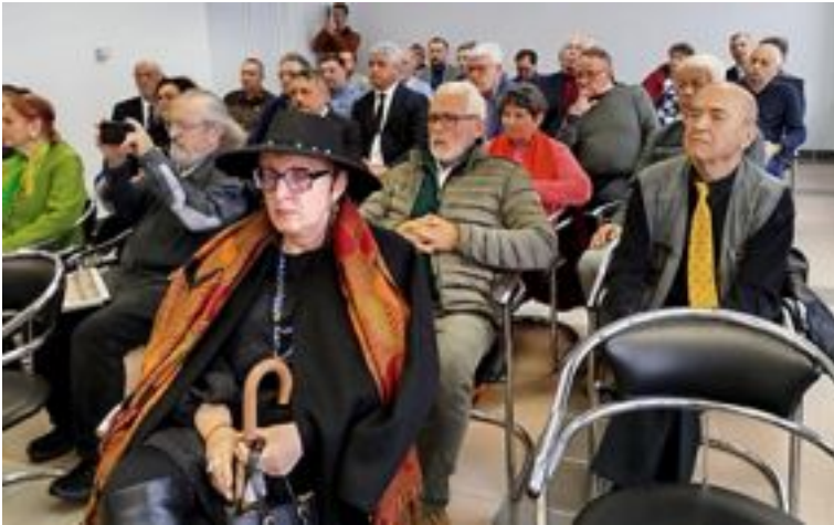
Imagine de la simpozion