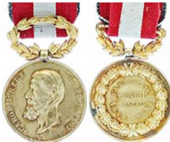
Medalia „Răsplata Muncii pentru Învățământ” clasa I (avers și revers).