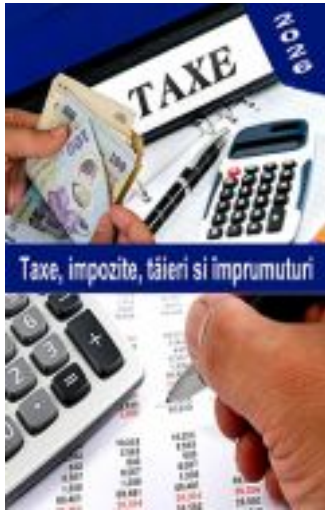
Taxe, impozite, tăieri și împrumuturi

Revin, cu același „Păi!” și reiterez: păi, pe cine vreți voi să amăgiți, asigurându-ne că statele foste imperii coloniale sunt afectate de traiul celor în suferință? Sau, de când altele, știute din istorie ca potențiali agresori și inițiatori de războaie, așa, dintr-odată, au chef să lupte pentru instaurarea păcii?! Nu, domnilor, o știți și voi, foarte bine: dincolo de orice slogan stau interese foarte mari. Interese, într-adevăr, coloniale. Așa că, nu ne mai amăgiți și nu ne înjosiiți, mai mult decât se poate accepta. Cu alte cuvinte, dincolo de orice „reforme în rău”, nu ne jigniți inteligența proferând deziderate, ale căror sensuri nici măcar nu le înțelegeți. Ori - și mai grav - dacă le știți, nu ne luați de proști. Păi, având în vedere starea economico-socială a țării, grav afectată