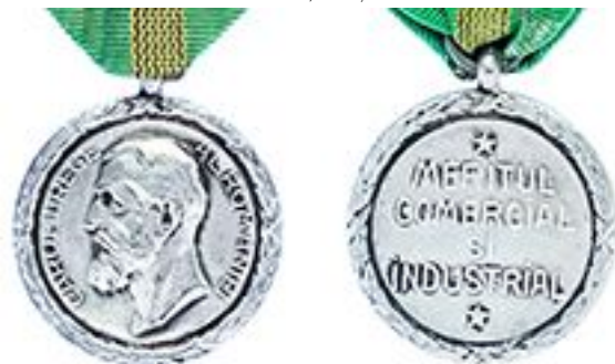
Medalia „Meritul Comercial și Industrial” clasa a II-a (avers și revers).