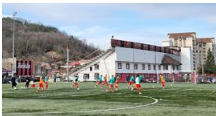
Reșița - Drobeta

an, toate însă amânate, conform portalului instanței de judecată, iar următoarea înfățișare este pe 11 februarie.