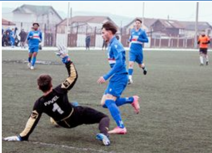
CS Drobeta - CS Corcova

După acest rezultat, cele două echipe au făcut rocada în clasament și sunt acum despărțite de 2 puncte. În partida-tur, mehedintencele le surclasaseră pe vâlcence, scor 31-18 (14-9). Sâmbătă, de la la 11:00, în Sala Polivalentă, ocupanta poziției secunde HC Decebal Mehedinți va disputa un nou derby, de data aceasta cu CSS Caracal, echipă aflată pe locul al 3-lea.