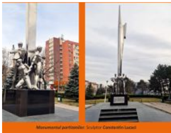
Monumentul partizanilor. Sculptor Constantin Lucaci

Contrar așteptărilor, lucrarea monumentală (Obeliscul) nu comemorează victimele represiunii germane (nefiind un memorial), în schimb celebrează ideea de libertate prilejuită de execuția celor 10 martiri (și) completată cu riscul sacrificiului suprem asumat de eroul gorjean. Cu bună știință, artistul a pus în operă o viziune care exprimă libertatea ca aspirație într-o narațiune cu un limbaj estetic "nou".