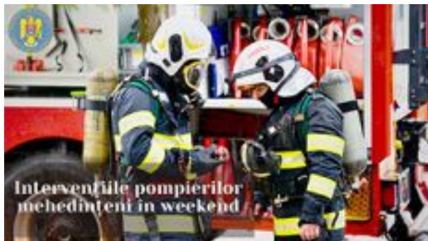
Intervențiile pompierilor mehedinteni în weekend

Pompierii militari din cadrul Inspectoratului pentru Situații de Urgență "Drobeta" al județului Mehedinți au intervenit, în acest weekend, pentru stingerea a șase incendii, gestionarea unui accident rutier, îndepărtarea unor elemente de construcție care se aflau în pericol de cădere, dar și pentru acordarea asistenței de urgență unui număr de 36 de persoane cu diverse afecțiuni medicale.