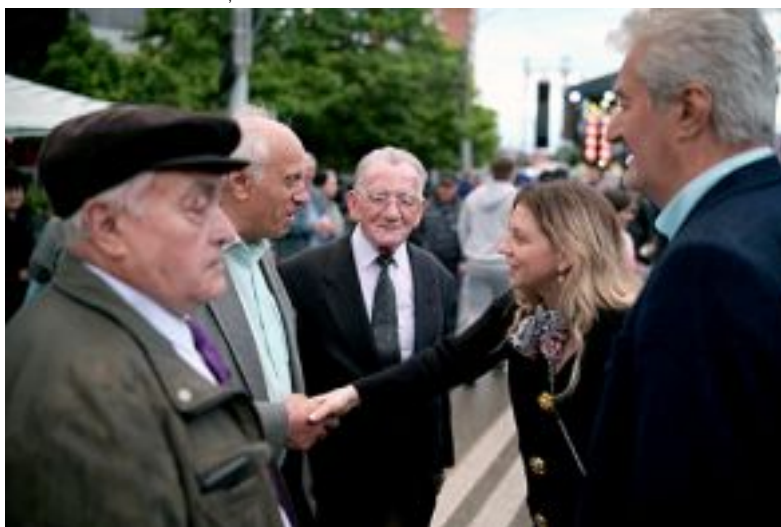
rândul orașelor care să conteze la nivel național. (CMF 21240022)

UNITĂ pentru PRIMĂRIA SEVERIN, au ascultat doleanțele severinenilor și au dezbătut probleme de interes pentru municipiu. Iar concluziile unanime au fost clare: Avem nevoie de dezvoltarea municipiului, de locuri de muncă și punerea în valoare a potențialului uriaș al acestui oraș dunărean, aducerea lui în