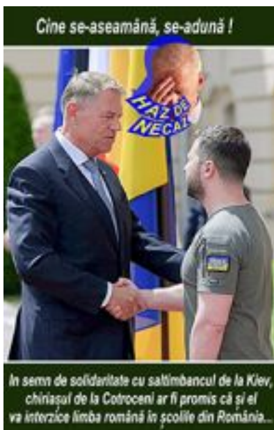
Cine se aseamănă, se-adună! În semn de solidaritate cu saltimbancul de la Kiev, chinșagul de la Cotroceni ar fi promis că și el va interzice limba română în școlile din România...

prin actele solicitate de Trump în cazul "Burisma". Credeți că Hunter Biden ar mai fi fost la conducerea "Burisma" dacă nu ar fi fost fiul lui Joe Biden, pe atunci vicepreședinte al SUA? După demiterea procurorului general al Ucrainei, Viktor Shokin, la solicitarea expresă a lui Joe Biden, "Burisma" a fost eliminată din calendarul justiției ucrainene, cazul fiind închis. Iată ce declara Joe Biden pe atunci: "Ei bine, nenorocitul - «son of a bitch» - fiu de tîrfă, cu referire la procurorul general, a fost concediat și înlocuit cu cineva care era puternic în acea perioadă", a declarat Joe Biden la evenimentul